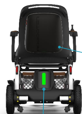
Batterie ternaire amovible (plus résistante)