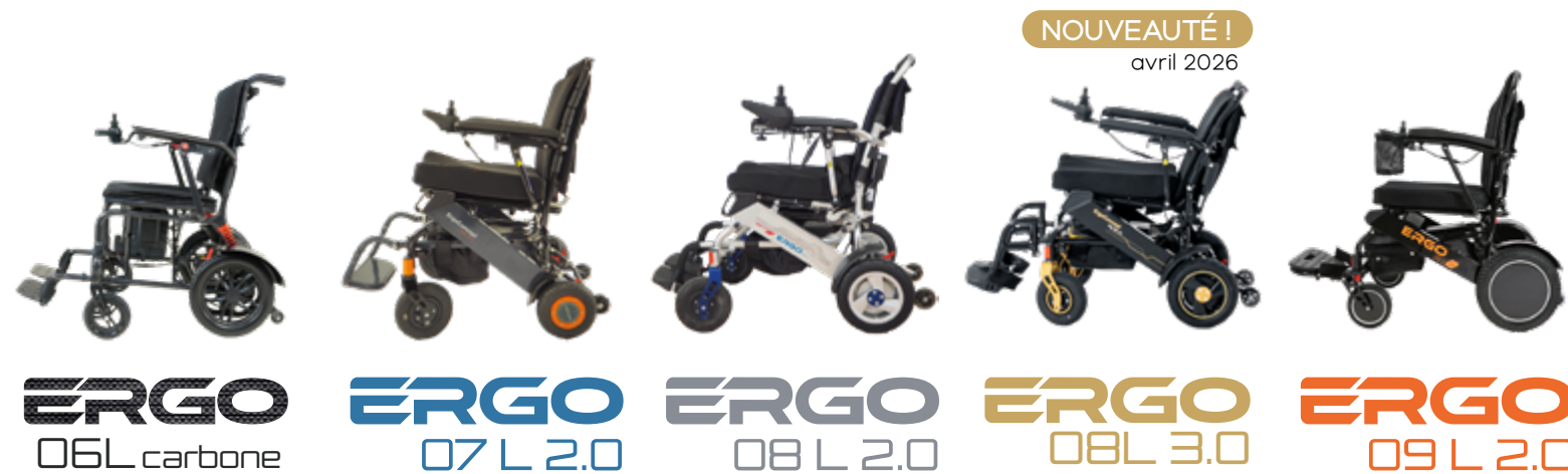
ERGO 06L carbone, ERGO 07 L 2.0, ERGO 08 L 2.0, ERGO 08L 3.0, ERGO 09 L 2.0