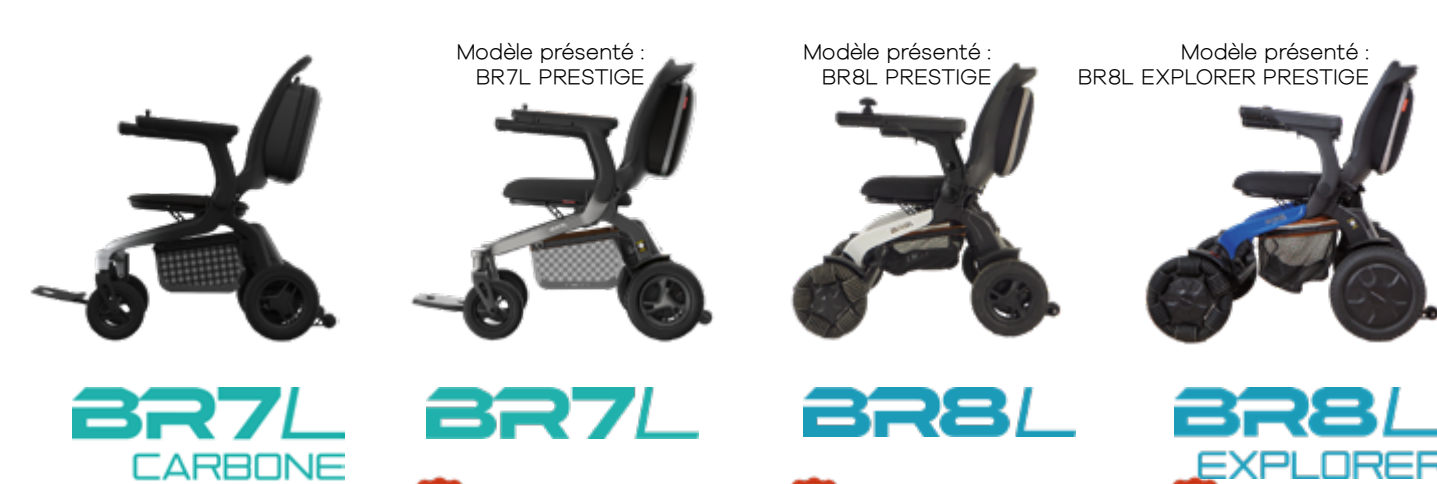
BR7L CARBONE, BR7L, BR8L, BR8L EXPLORER