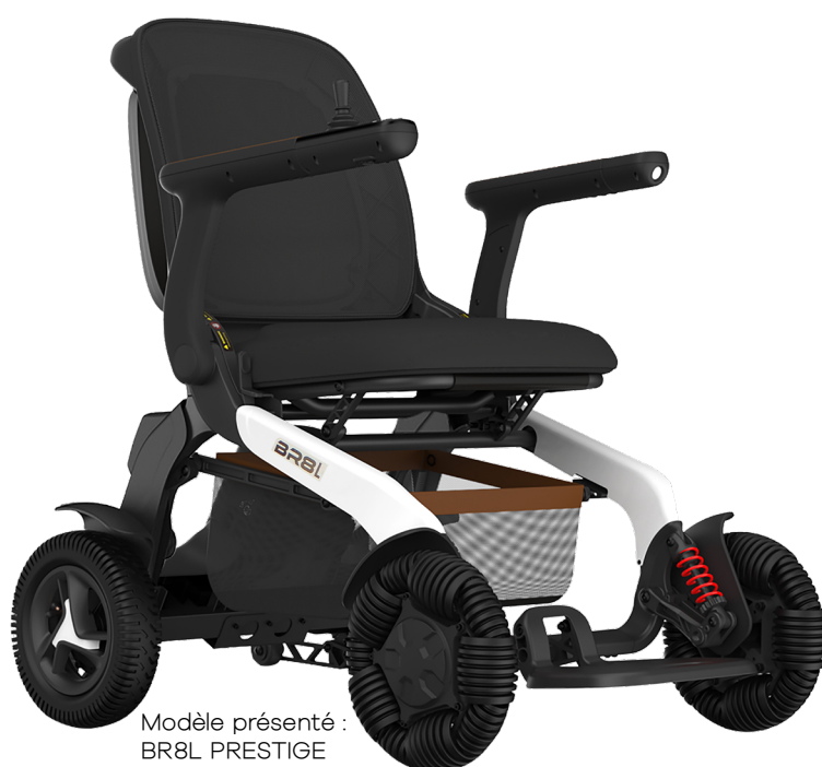
Modèle présenté : BR8L PRESTIGE

SOLUTIONS de MOBILITÉ RÉVOLUTIONNAIRES ! pour personnes à mobilité réduite