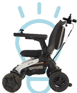
Modèle présenté : BR8L Compagnon Prestige