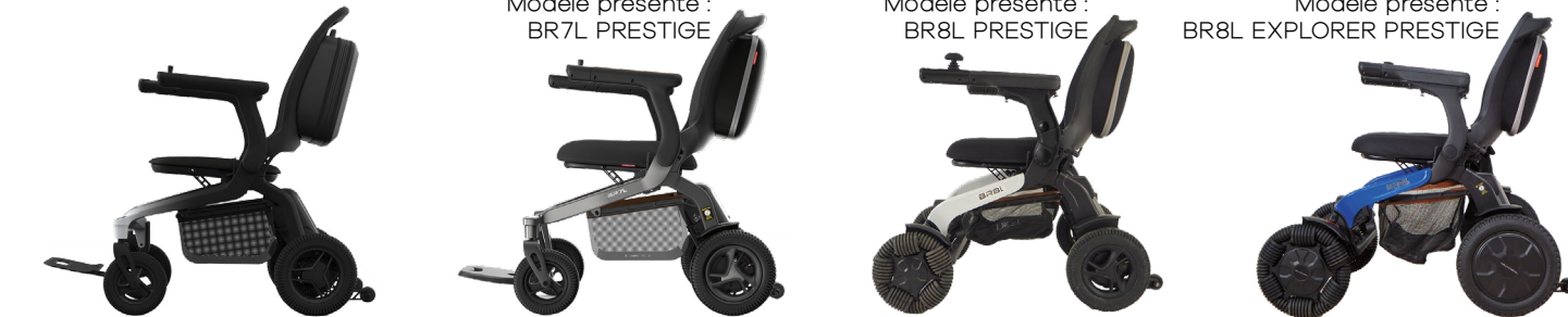
BR7L CARBONE BR7L BR8L BR8L EXPLORER

Modèle présenté : BR8L EXPLORER PRESTIGE