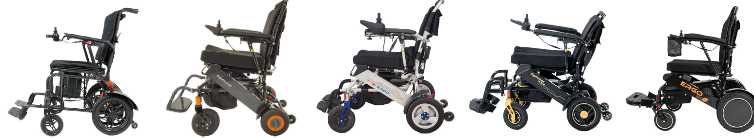
ERGO 06L carbone ERGO 07 L 2.0 ERGO 08 L 2.0 ERGO 08L 3.0 ERGO 09 L 2.0