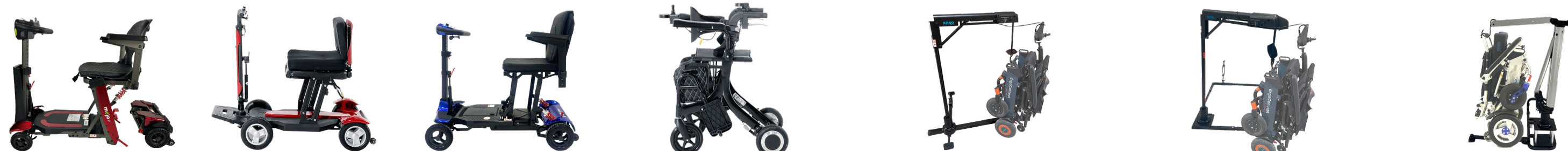
ERGO MOJO Lit ERGO SNAKE ERGO SWIFTY E-WALK ERGO ATLAS 40 ERGO ATLAS 40 ISOFIX ERGO ATLAS 60